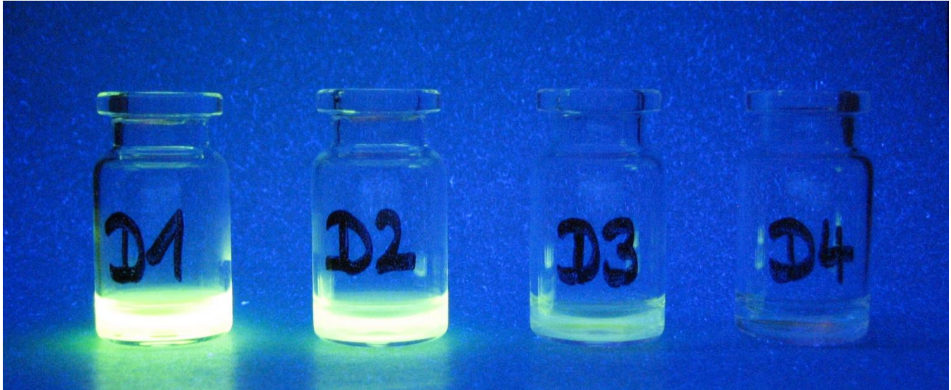
UV-Fluoreszenz von Lösungen mit unterschiedlichen Konzentrationen an Riboflavin.

Sprechen Sie uns an, wenn Sie Tests zur Überprüfung der Effizienz Ihrer Reinigungsmaschine planen. Wir unterstützen Sie!